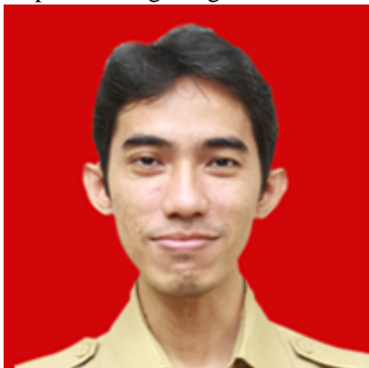
Kepala Bidang Pengelolaan Teknologi Informasi